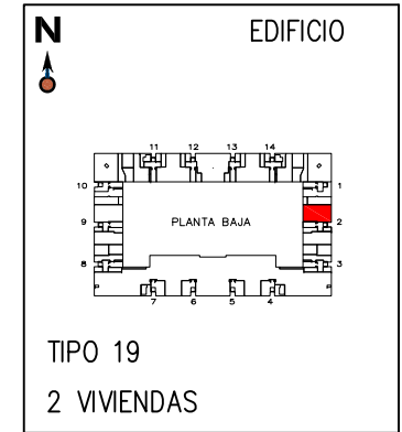
TIPO 19 2 VIVIENDAS